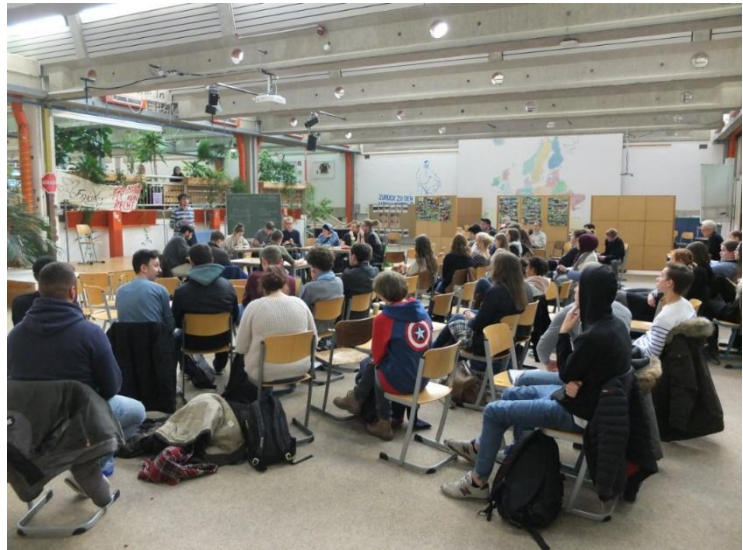
Abbildung: Parlamentarische Debatte der Kurse im Plenum: Ist die Struktur der offenen Lernräume notwendig für das Oberstufen-Kolleg? (09.12.2016)

Da die Kurse im Stundenplan parallel stattfinden (was eine organisatorische Bedingung für die kursübergreifende Gruppenbildung und Arbeitszeiten ist), können aus dem Problembewusstsein der Kollegiat:innen und den genannten Standards – im Plenum aller Kurse des Kursverbunds – die Arbeitsthemen für die Weiterentwicklung des Kollegs entwickelt werden. Eigenständige Projektgruppen bilden sich dann interessengeleitet kurs- und jahrgangsübergreifend. Alle Teilnehmenden arbeiten in 1/3 der Kurszeit selbstbestimmt an der Umsetzung ihrer Arbeitsthemen zur Schulentwicklung und Mentoring. In den vier Kursen des Kursverbunds können sich so etwa 100 Kollegiat:innen pro Schuljahr aktiv an der Gestaltung des Schullebens.